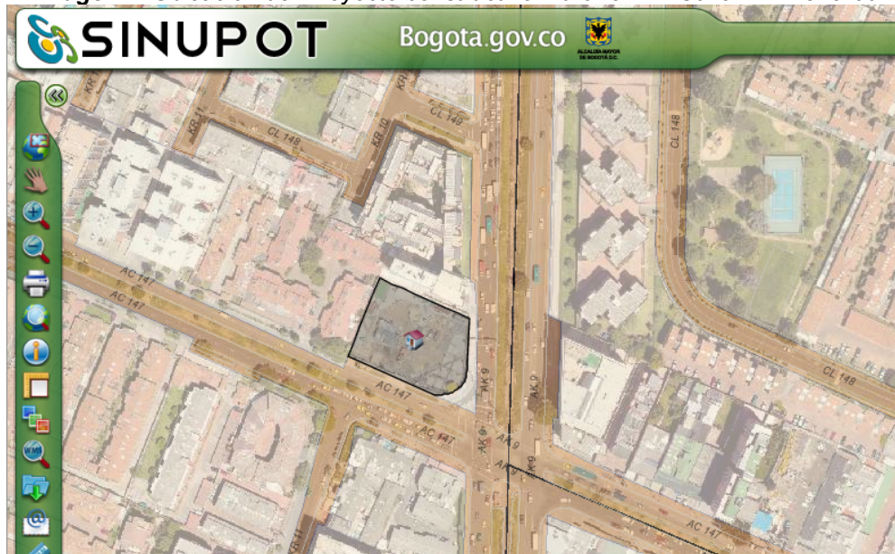
Imagen 1. Ubicación del Proyecto constructivo Murano. Av. Calle 147 No. 9-60

El proyecto constructivo Murano, ejecutado por la empresa CONSTRUCCIONES PORTOBELLO S.A.S se encuentra ubicado en la Av. Calle 147 No. 9-60 de la localidad de Usaquén, UPZ Los Cedros, barrio Cedritos; a continuación, en la imagen 1, se muestra la información geográfica del predio.